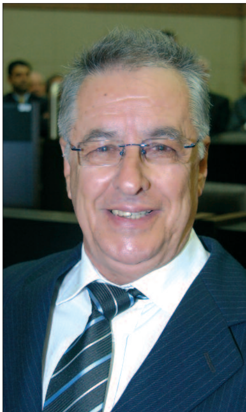
“O Vibrante” é o autor do Projeto que virou lei em BH